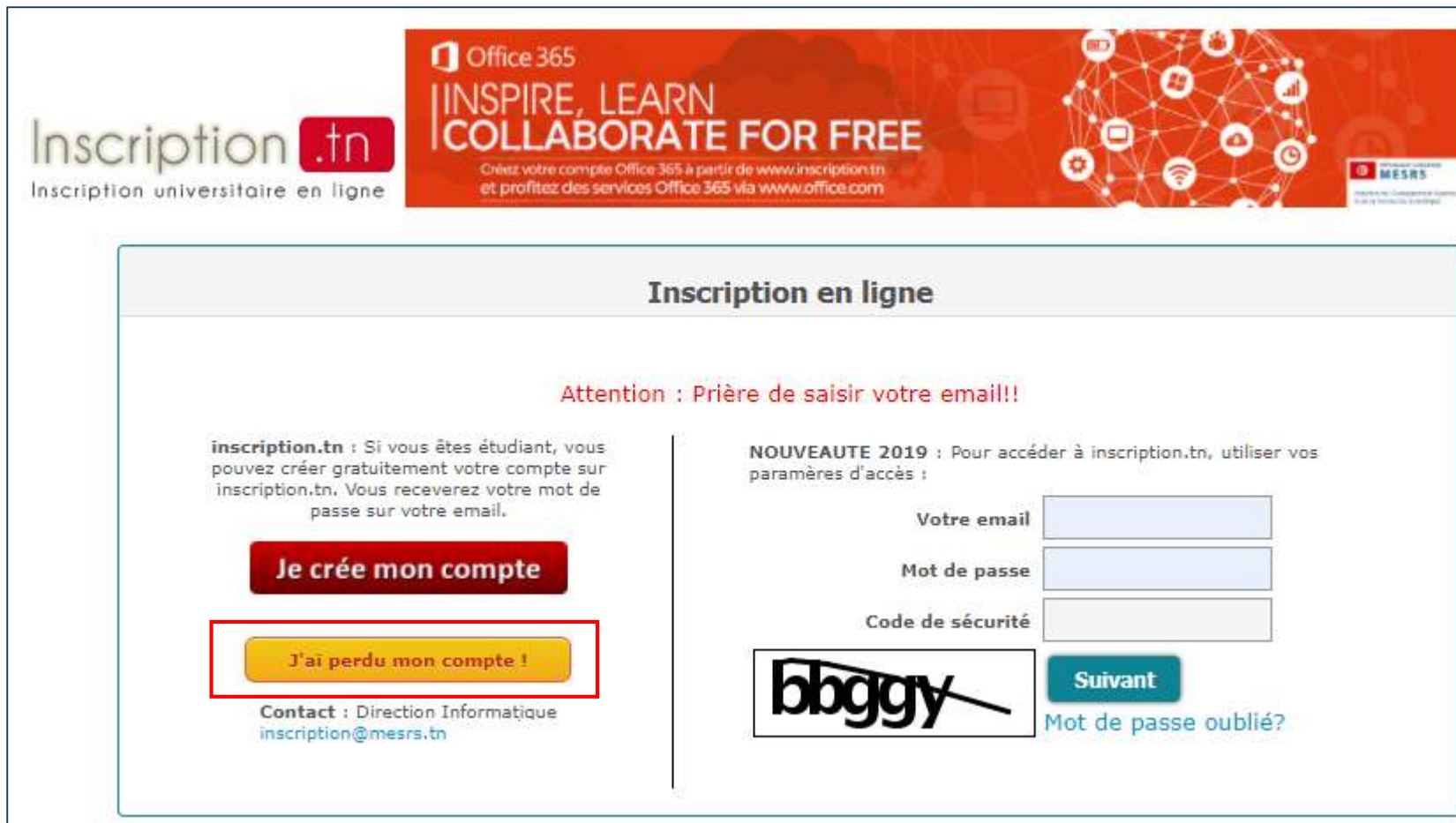
Figure 3 : Interface de suppression de compte d'étudiant